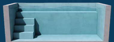
BENCH CORNER 1