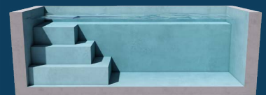
BENCH SQUARE 1