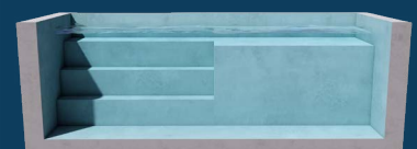
BENCH TOUTE LARGEUR 1