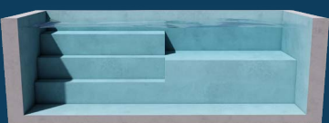
BENCH TOUTE LARGEUR 2