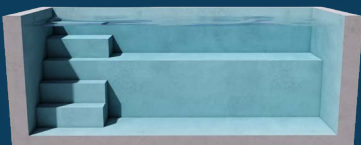
BENCH CORNER 2