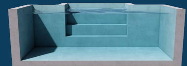
DROIT ET DROIT 2