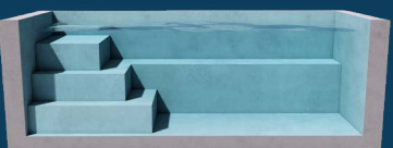
BENCH SQUARE 2